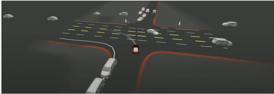
تصور لتدريب الشبكة العصبية