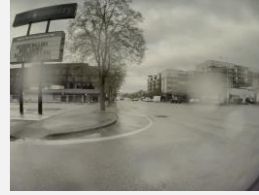
التحقق من خطوط الحارات