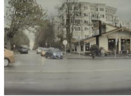
الكشف عن المشاة