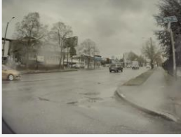
التعرف على المركبات